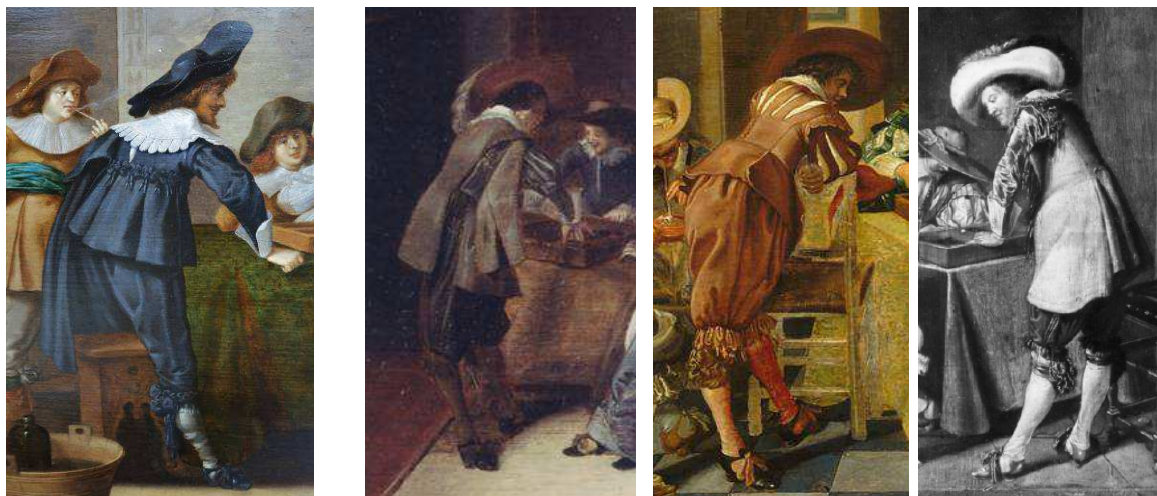
Sotheby's, 18 mai 2004, lot 114 (détail) / Lille, Palais des Beaux-arts (détail) / Anciennement Galerie Van Diemen & Co (détail).