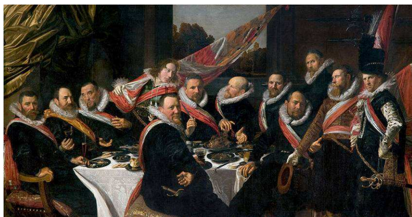
Fig1 : Frans Hals, Le Banquet des officiers du corps des archers de Saint-Georges , 1616, huile sur toile, 172 x 324 cm, Haarlem, Frans Hals Museum.