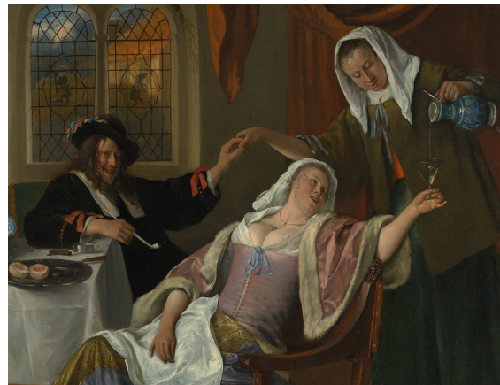
Fig.14 : Jan Steen, Le Ménage dissolue , 1663-64, New-York, Metropolitan Museum of Art