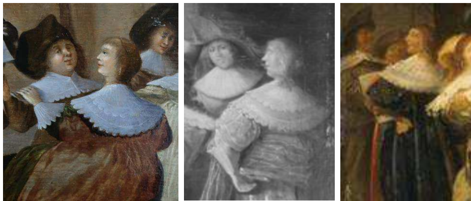
Fig.10 : Comparaison entre une faiblesse anatomique d'un personnage secondaire dans notre tableau et d'autres tableaux de Dirck Hal : Aix la chapelle, Suermondt-Ludwig Museum (détail) / Vienne, Dorotheum, 20 octobre 2015, lot 261 (détail).