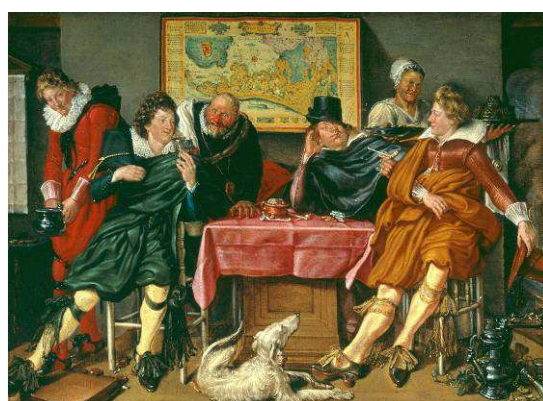
Fig.2 : Esaias Van de Velde, La Fête champêtre , 1615, Amsterdam, Rijksmuseum / Willem Buytewech, Joyeuse compagnie , c.1620, Rotterdam, Museum Boijmans van Beuningen.