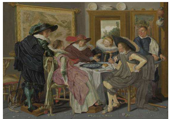
Fig.5 : Dirck Hals, "Joyeuse compagnie" dans un intérieur : 1628, huile sur panneau, 40.6 x 66 cm, New-York, Metropolitan Museum of Art / 1626, huile sur panneau, 28 x 38.8 cm, Londres, National Gallery.