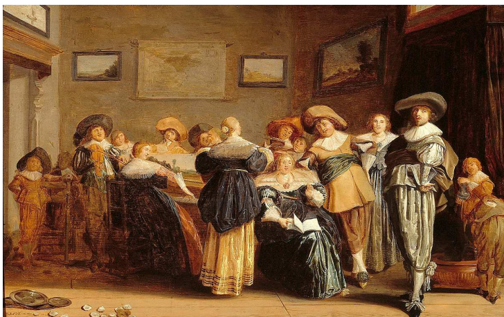
Fig.15 : Dirck Hals, Partie musicale dans un intérieur , 1633, Haarlem, Frans Hals Museum.