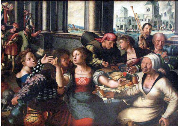
Fig.3 : Jan Sanders Van Hemessen, La Parabole du fils prodigue , 1536, Bruxelles, Musées royaux des Beaux arts de Belgique.