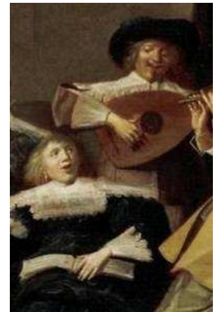
Haarlem, Frans Hals Museum (détail) / Cologne, Lempertz, 22 novembre 2008, lot 1278 (détail).