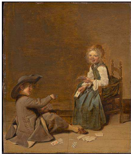
Fig.7 : Dirck Hals, Enfants avec un chat / Enfants jouant aux cartes , 1631, huile sur panneau, 32.7 x 27.9 cm (chacun), Williamston (Massachusetts), Sterling and Francis Clark Institute.