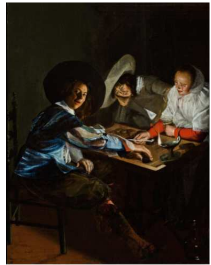
Fig.13 : Dirck Hals, Partie de trictrac , Lille, Palais des Beaux-arts / Judith Leyster, Partie de trictrac , 1630, Worcester Art Museum.