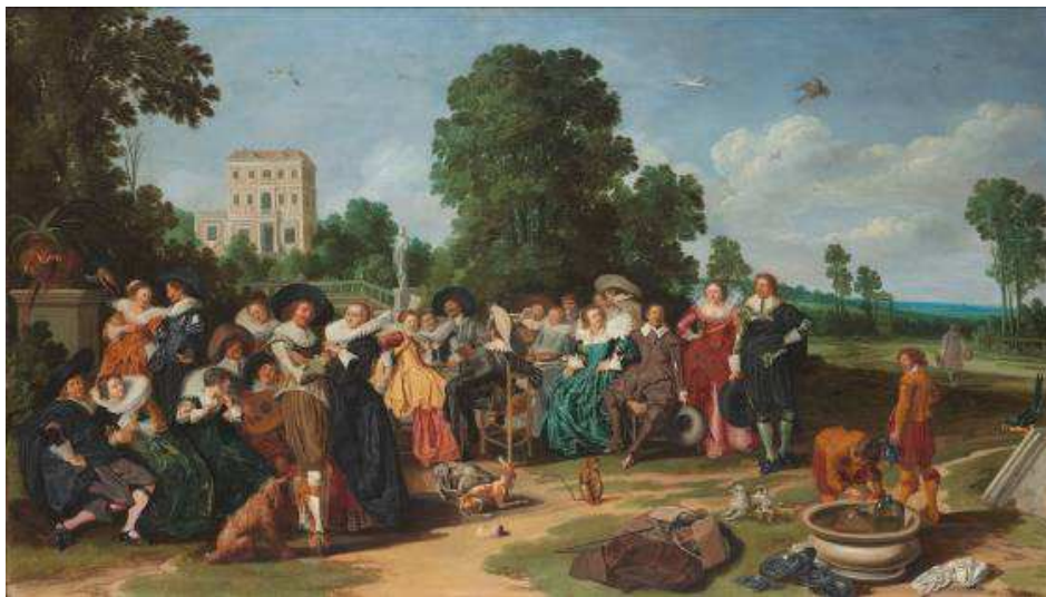
Fig.4 : Dirck Hals, La Fête extérieure , 1627, huile sur panneau, 77,6 × 135,7 cm, Amsterdam, Rijksmuseum.