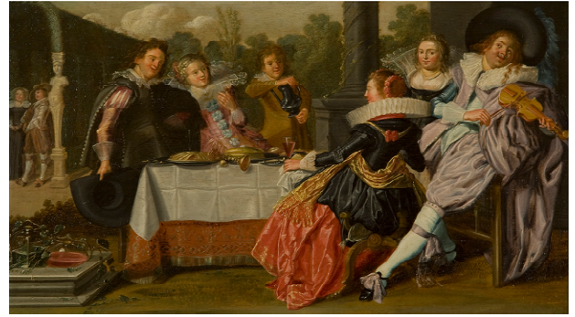
Fig.6 : Dirck Hals, Paire de "Joyeuses compagnies" , 1623, huile sur panneau, 30 x 51 cm (chacun), Salt Lake City, Utha Museum of Fine Arts.