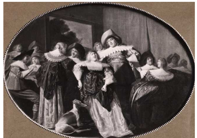
Fig.12 : Dirck Hals, huile sur panneau, 37 x 50 cm, Cologne, Lempertz, 15 mai 2010, lot 1641 / Dirck Hals, huile sur panneau, 35 x 70 cm, Zurich, Kunsthaus Ebel Dietikon, 11 novembre 1982.