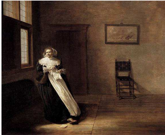
Fig.9 : Dirck Hals, Femme déchirant une lettre , 1631, huile sur panneau, 45 x 55 cm, Mainz (Mayence), Landesmuseum.