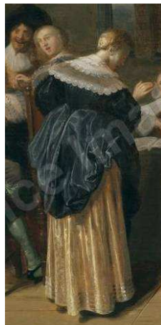
Haarlem, Frans Hals Museum (détail) / Vienne, Dorotheum, 12 octobre 2011 (détail).