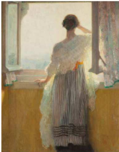
Fig.4: Franz Van Holder, Lumière , Collection de la Province du Brabant wallon.