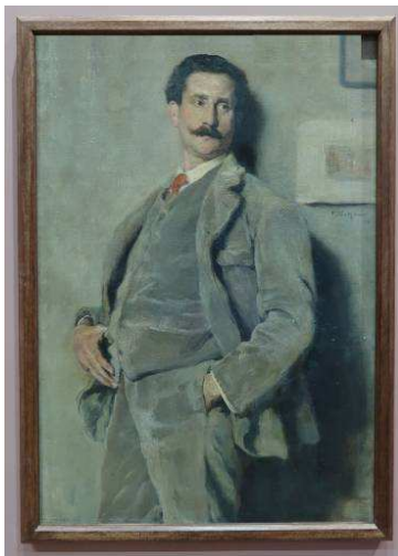
Fig.2: Franz Van Holder, Portrait de Philippe Wolfers , 1907, Bruxelles, Musées Royaux des Beaux-Arts de Belgique.