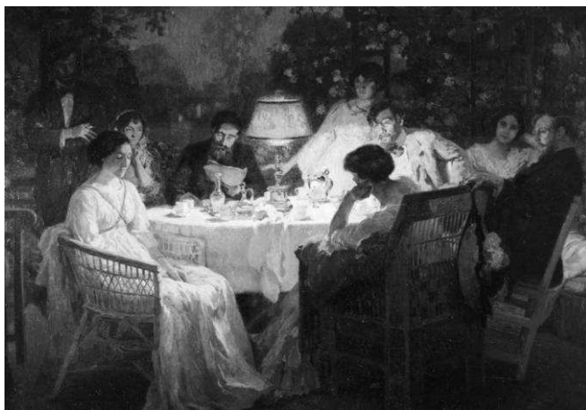
Fig.5: Franz Van Holder, Un Soir , 1912, Bruxelles, Musées Royaux des Beaux-Arts de Belgique.